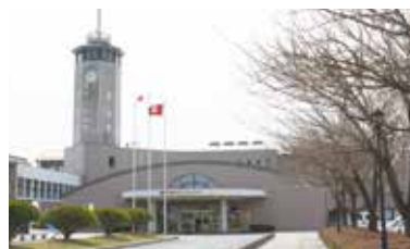
現センター所在地 (二宮コミュニティセンター)