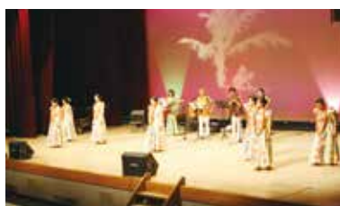
真岡コラボまつり