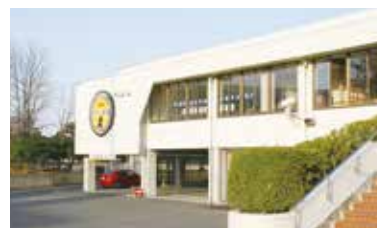
初代センター外観(スポーツ交流館)